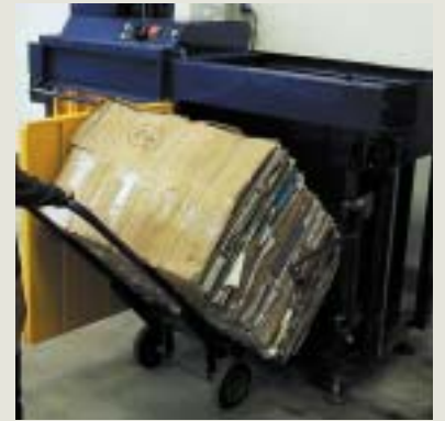
Vyjmutí hotového balíku z lisu s pomocí manipulačního rudlu

Jsmo firmou, která se specializuje na technologie pro nakládání s odpady. Zajišťujeme vývoj i výrobu široké škály hydraulických balíkovacích lisů, které se navzájem liší lisovacím tlakem, hodinovým výkonem, ale i velikostí lisovacího prostoru. Jsme firmou z letitými zkušenostmi v oboru a díky tomu můžeme zodpovědně prohlásit,