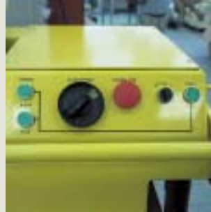
Ovládací panel lisu