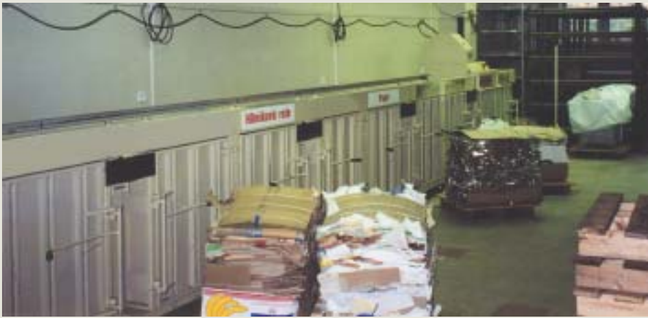
Sestava desetikomorového lisu v AVX Lanškroun