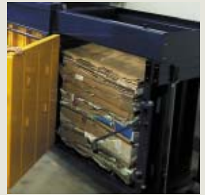
Slisovaný a svázaný balík kartonáže v lise - hmotnost balíku 85kg