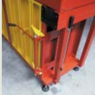
Detail otevírání dveří