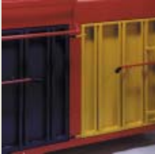
Barevné řešení lisu podle požadavků zákazníka